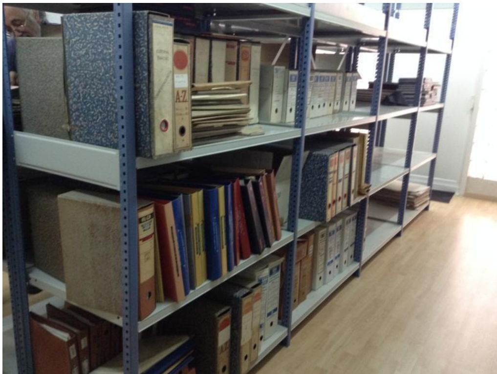
Vista del fons documental ubicat a la seu de l'editorial, abans del seu ingrés a la BC.